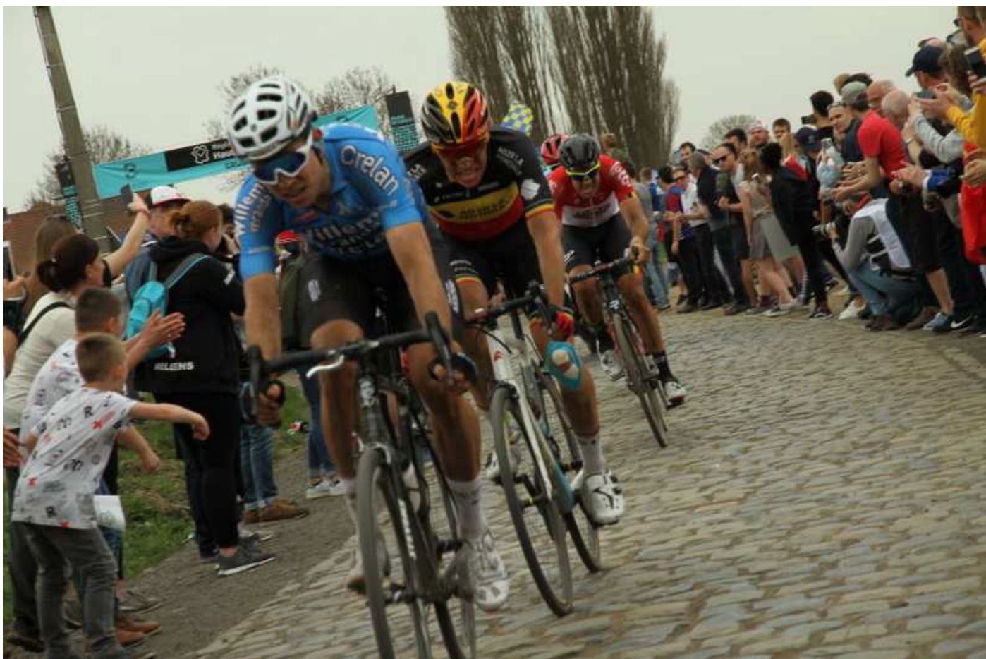
116 e Paris-Roubaix le 08/04, remporté cette année par le Slovaque Peter SAGAN