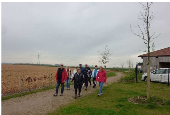
Grus'Rando – Parcours du Cœur à Gruson le 08/02