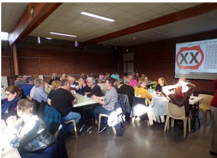
Loto des 3AG le 07/04