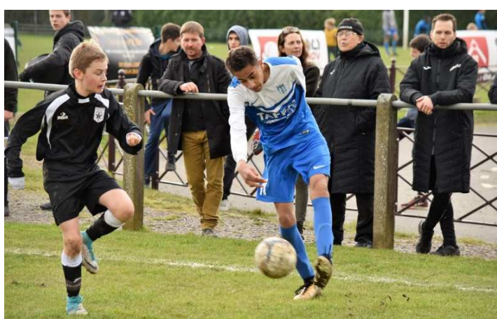
Tournoi International de Pâques les 31/03 et 01/04 – remporté cette année par le Villeneuve d'Ascq Lille Métropole