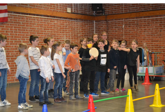
Fête du Printemps de l'École Pasteur le 24/03