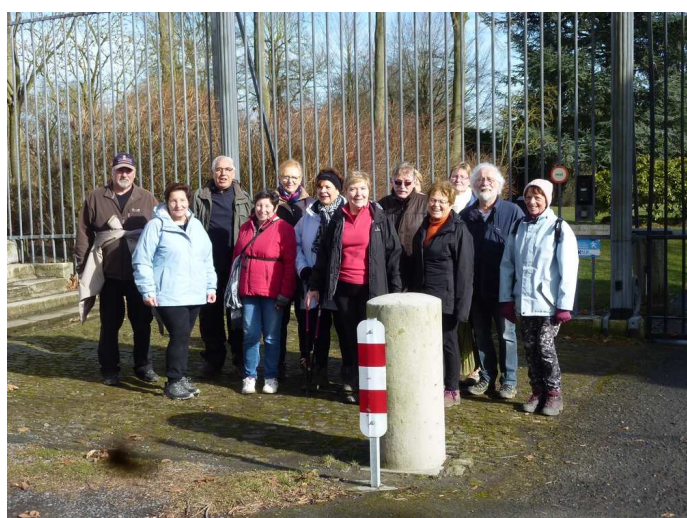
Grus'Rando à Chercq (BEL) le 04/03