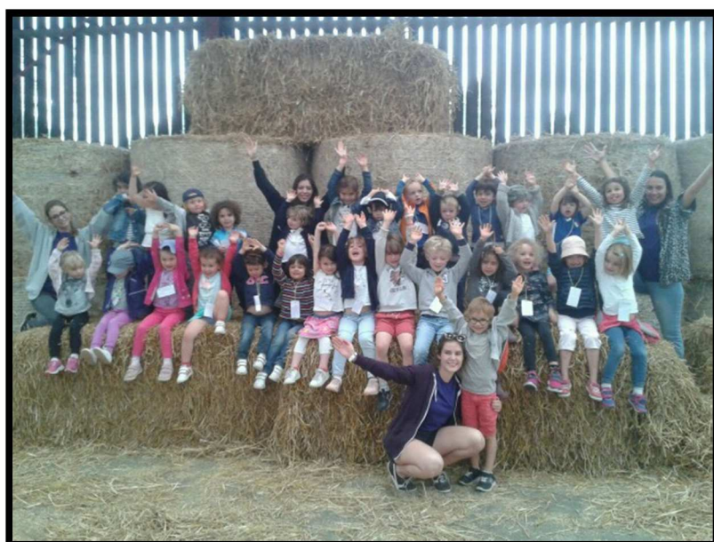
Centre de Loisirs en Juillet