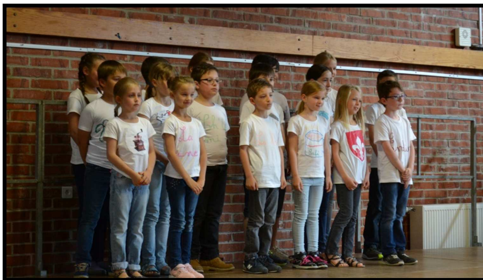
Fête de l'École Pasteur le Samedi 25 juin