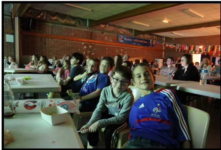
Finale de l'EURO 2016 à la Salle Polyvalente le Dimanche 10 juillet