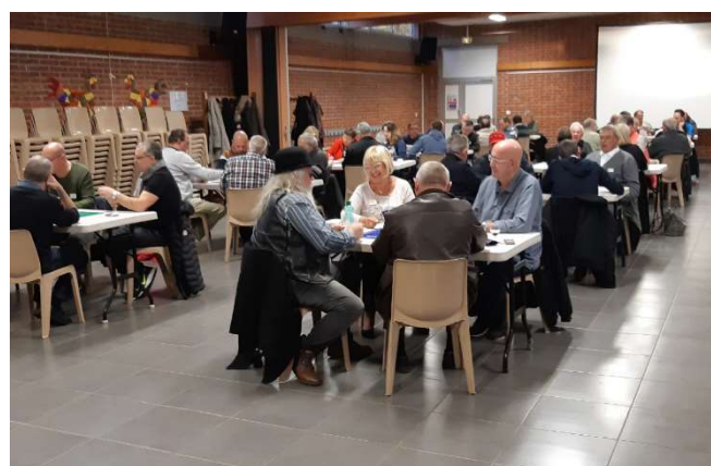
Concours de belote des 3AG (dimanche 11 novembre)