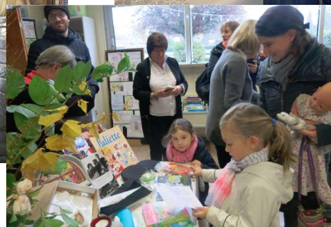
Les 30 ans de la Bibliothèque (Dimanche 25 novembre)