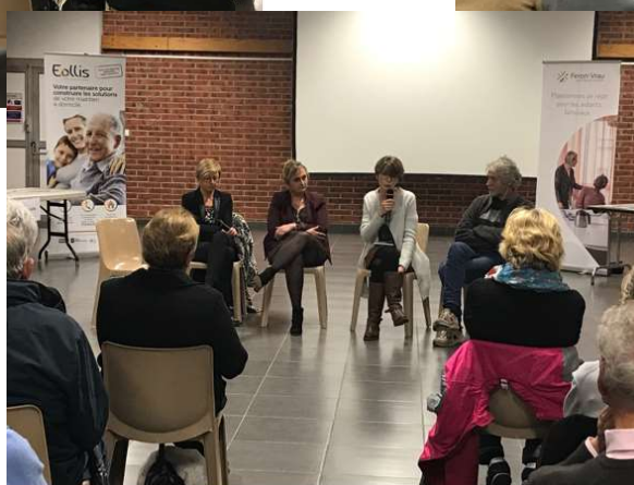
Conférence Alzheimer (Vendredi 9 novembre)