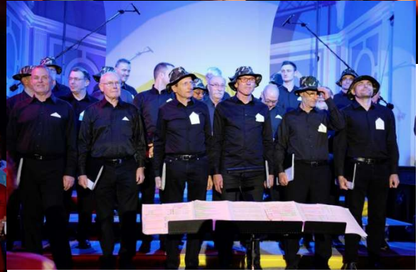
Festicoeur (Vendredi 16 au Dimanche 18 novembre)