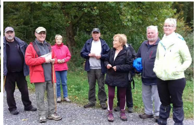
Le Circuit à Phalempin (dimanche 7 octobre)