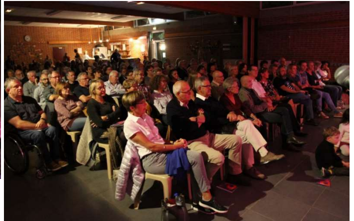
Concert de Jazz (Vendredi 5 octobre)