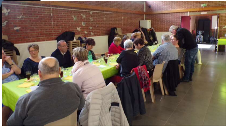
Repas Choucroute des 3AG (Dimanche 14 octobre)