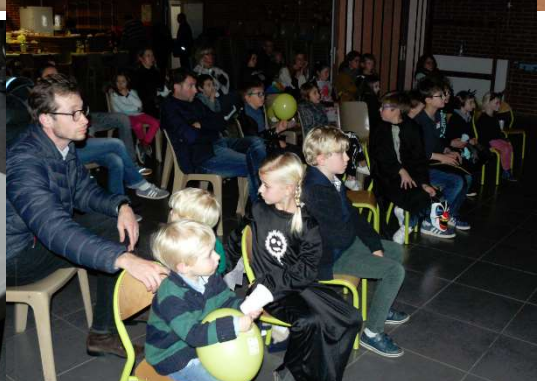
ALSH Automne (Lundi 22 au Mercredi 31 octobre)