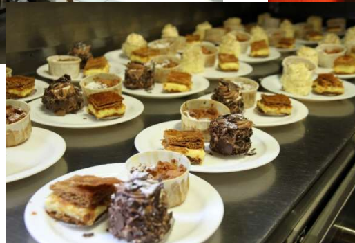
Goûter automnal (Samedi 6 octobre)