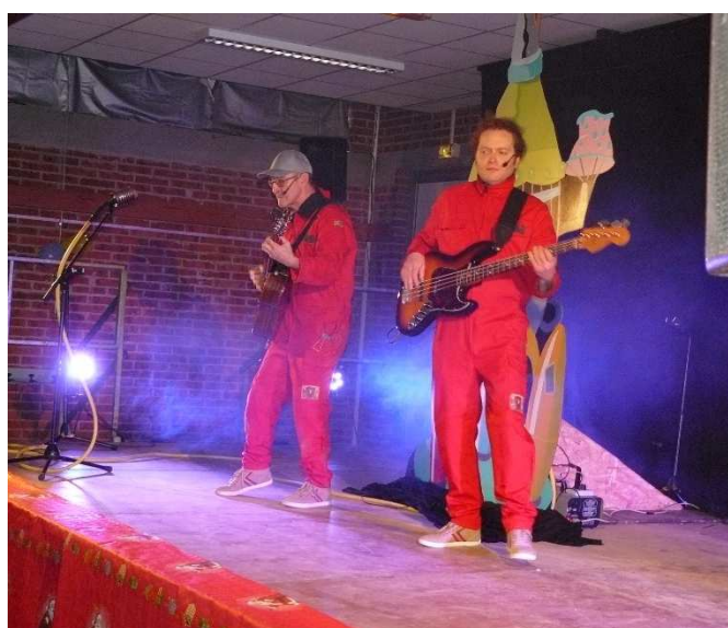
Arbre de Noël le 17/12