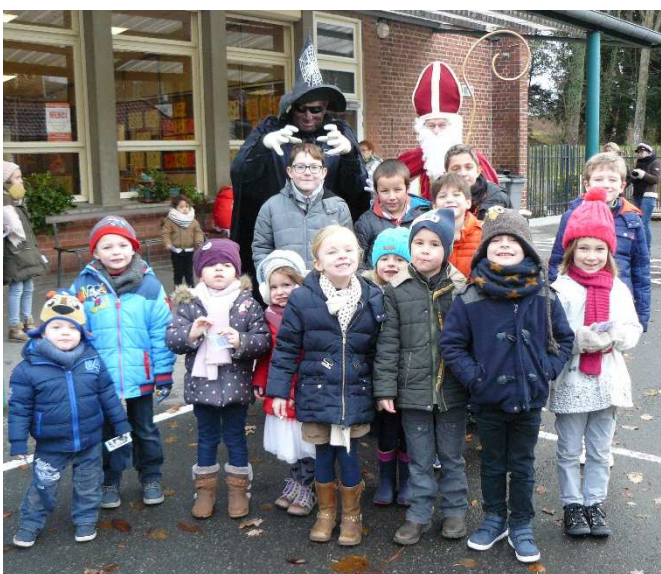
Saint-Nicolas dans les écoles le 08/12