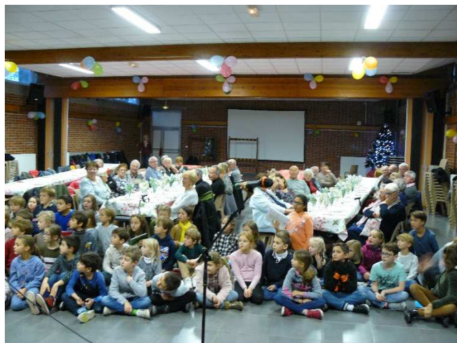
Gouter Inter-génération le 07/12