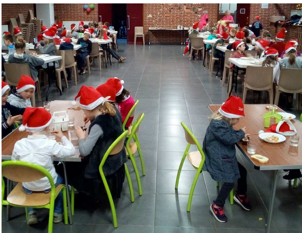
Repas de Noël à la cantine pour le dernier jour de classe !