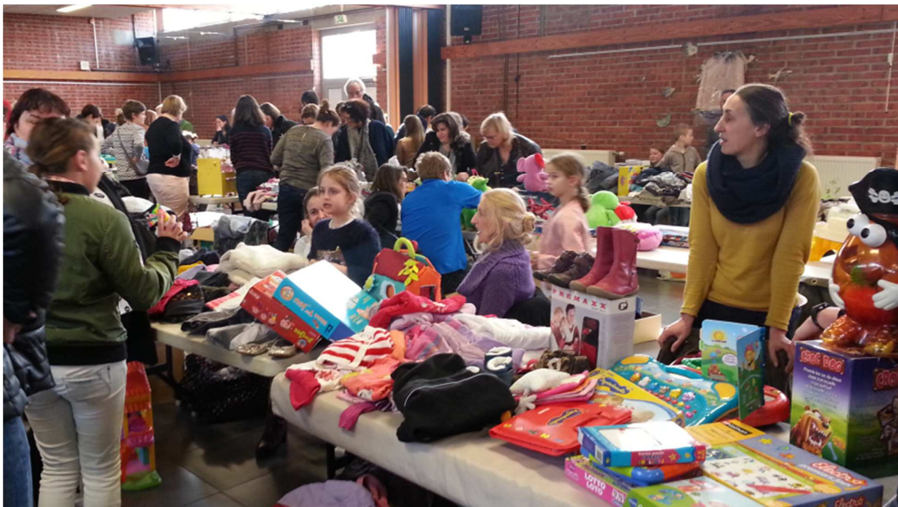
Braderie de l'école Pasteur