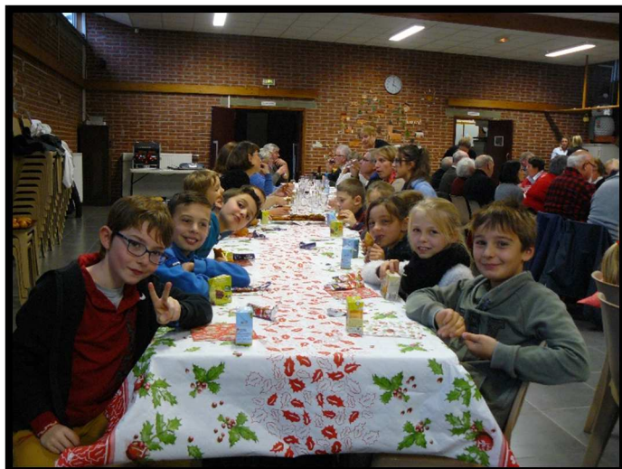
Goûter Inter-génération le 01/12