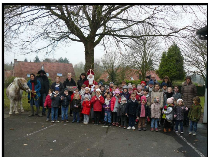
Saint-Nicolas dans les écoles le 02/12