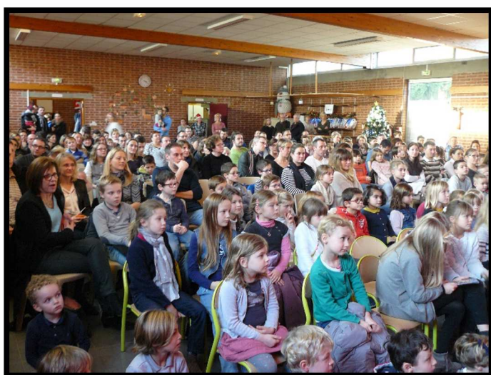
Arbre de Noël le 11/12